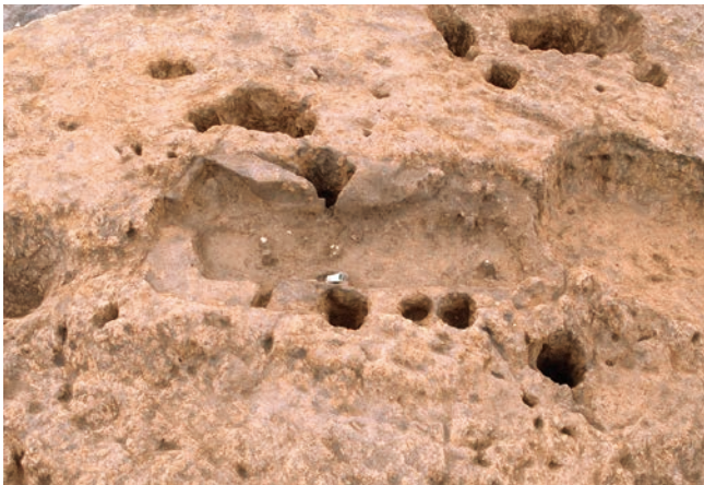
小銅鐸が見つかった様子